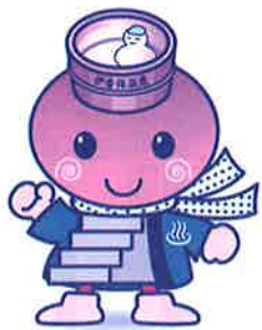
伊香保温泉のキャラクター「いしだんくん」